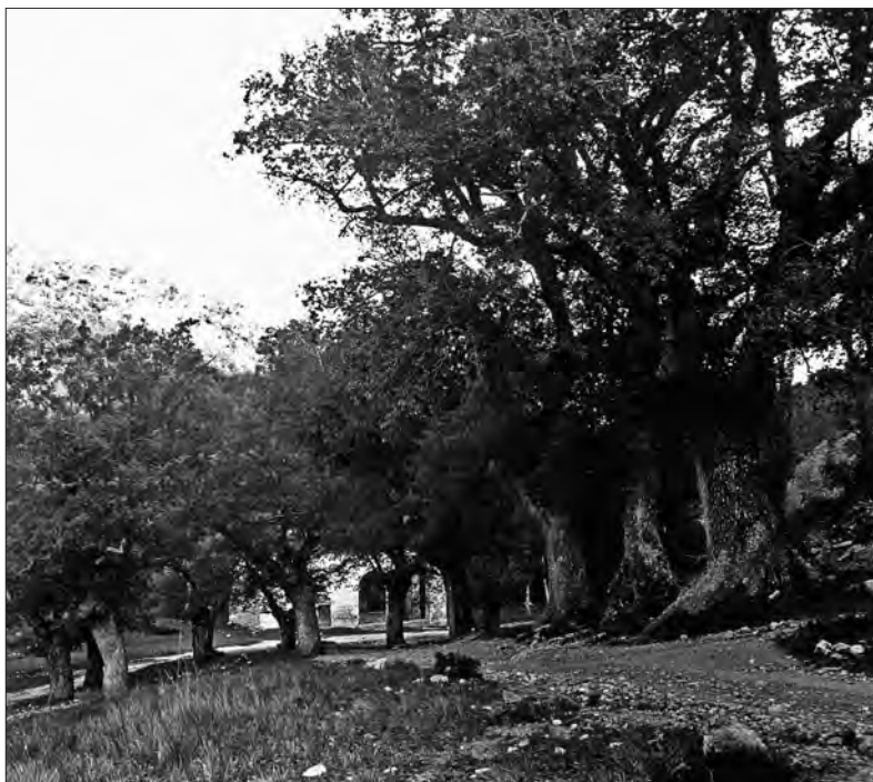
□ Figura 2: Al fons, la Capella de les Fonts de Sant Magí de la Brufaganya. Cal observar els impressionants roures del camí que ascendeix al santuari. 11 de maig de 1913.