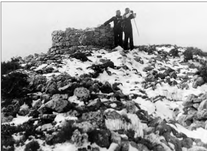
□ Figura 5: El cim de Montagut nevat. Gener de 1928.

Ens trobem a 960 metres d'altitud sobre el nivell de la mar. Al lluny albirem els gegants encantats de Montserrat, com si fos l'orgue del cel; d'entre un fons negrós sobreixen les sinuositats molsudes del Montseny, tot just blanquejades per la neu, i davall dels nostres peus s'estén tot el Camp de Tarragona, sembrat de comes ventrudes i de pujols llisos i boteruts, el mateix que una mar d'onades en eterna marejada. Els lleganys de boires esfilagarsades, escampats pel firmament, si bé no gosen a tapar el sol, entelen la terra una alenada melangiosa i un color incert, i les formes de les coses s'esmunyen del nostre esguard escorcollador, i les fantasies de l'esperit tafaner s'esfumen com per encant.