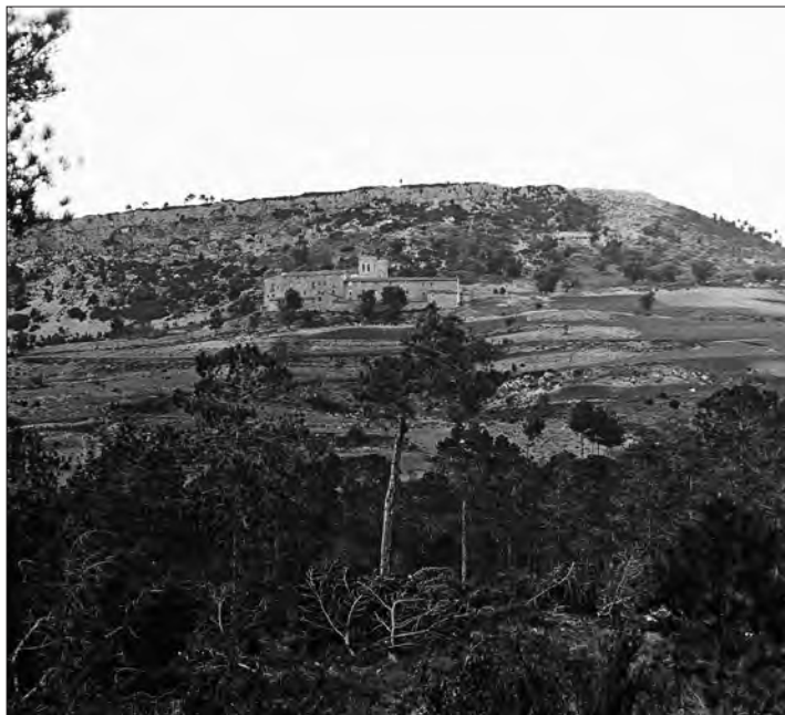
□ Figura 1: El santuari de Sant Magí de la Brufaganya. 11 de maig de 1913.