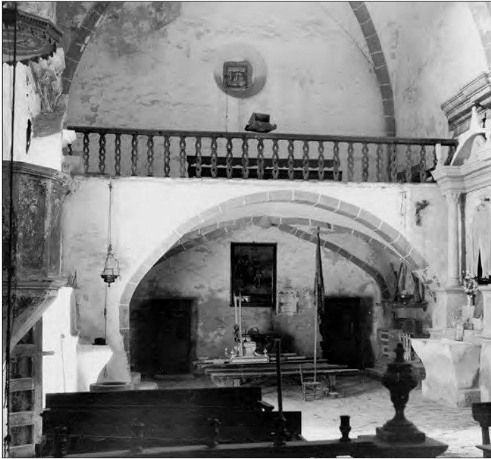
□ Figura 7: Interior de l'església parroquial de Montagut que Francesc Blasi Vallespinosa va poder fotografiar abans de la destrucció de 1936.

parets laterals, fetes de carreus treballats, descoberts a l'exterior i tapats per gruixuda capa de guix a l'interior, possiblement adient a reformes posteriors. Les imatges són d'escassa vàlua artística, llevat d'una que ha estat traslladada a Valldossera.