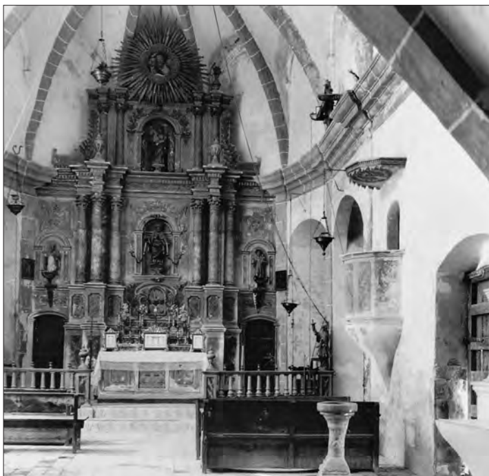
❑ Figura 6: Conjunt de l'església i la rectoria de la parròquia de Sant Jaume de Montagut.

Havent baixat del puig de Montagut cap a l'església de Sant Jaume, en descrivia l'estat de conservació i també el sentiment de soledat que s'hi respirava: