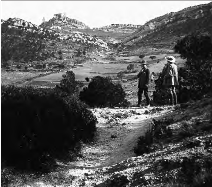
□ Figura 3: De camí cap al castell de Queralt. 11 de maig de 1913.