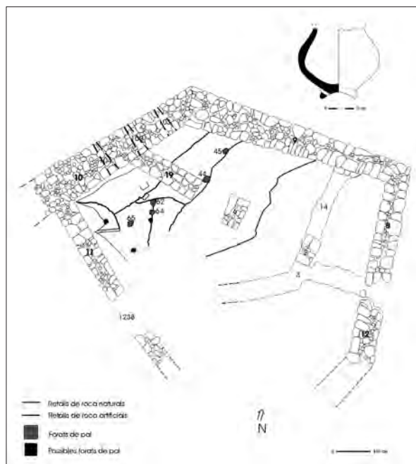
□ Figura 2: Detall de la planimetria del sector A, el qual fa referència a la sala situada a l'extrem nord-est del recinte sobirà. S'hi indiquen els forats de pal relacionats amb la presència d'hàbitats en fusta característics del bronze final (1000 – 800 aC). Adjunt, el dibuix d'una urna funerària del mateix període localitzada durant l'excavació del nivell.

presència uniforme de materials ceràmics diagnòstics i restes d'estructures d'hàbitat (forats de pal) indicarien l'existència de cabanes el·lipsoïdals. Tot plegat, elements relacionats amb l'arribada de la cultura dels camps d'urnes al nostre territori entre els anys 1000 i 800 aC.