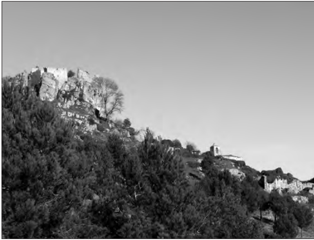
□ Figura 1: Vista del nucli de Selmella des del sud-oest.

ampliar el coneixement sobre l'origen i l'evolució de les fortificacions que constituïren la frontera extrema entre el comtat de Barcelona i el califat de Córdoba durant els segles X i XI.